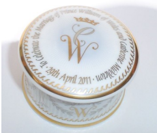
Die ersten Hochzeits-souvenirs sind bereits auf dem Markt.

Während geschmacklose Republikaner bereits Kotztüten verkaufen ("Keep this handy on April 29th"), reiben sich die Geschäftsleute die Hände. Mit 600 Millionen £ zusätzlichem Umsatz rechnen die Ökonomen, die das französische Wirtschaftsmagazin Les Echos zitiert. Rund eine Millionen Besucher werden am 29. April in den Straßen Londons erwartet, viele davon aus Übersee. Niemand ermittelte bislang, wie sich dieses Wirtschaftswachstum auf die Steuereinnahmen des Schatzkanzlers auswirken wird, aber sie dürften mehr als das Doppelte der 50 Millionen £ betragen, die für die Kosten der Hochzeit (weniger für die