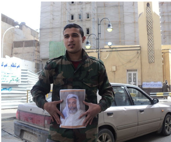
König Idris I. von Libyen ist unvergessen in Benghazi.

Das Hissen der Fahne des libyschen Königreichs ist dabei mehr als nur ein Zufall. Zwar existierte Libyen bis zum Ende des 2. Weltkrieges nicht als eigener Staat und das einzige Regime, welches dem des Obersten Qaddafi voranging, war die kurzlebige Monarchie (1951-1969). Auf eine andere Fahne könnten die Aufständischen also gar nicht zurückgreifen. Jedoch ist das Zentrum des Aufstandes der Osten des Landes, die Cyreneika, eben der Landesteil aus dem die königliche Familie stammt.